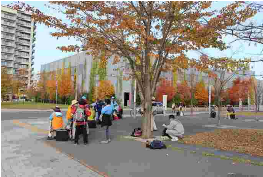
東札幌の「札幌コンベンションセンター」前で休憩。