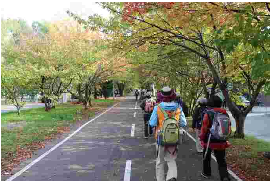
コースはサイクリングロードに入り、両側の緑も豊かになり、車道との交差による分断もなく雰囲気が良くなって来ました。